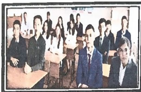
«Мамандық таңдау – ертеңді ойлау» «Жүктіліктің алдын - алу, ерте жүктілік»